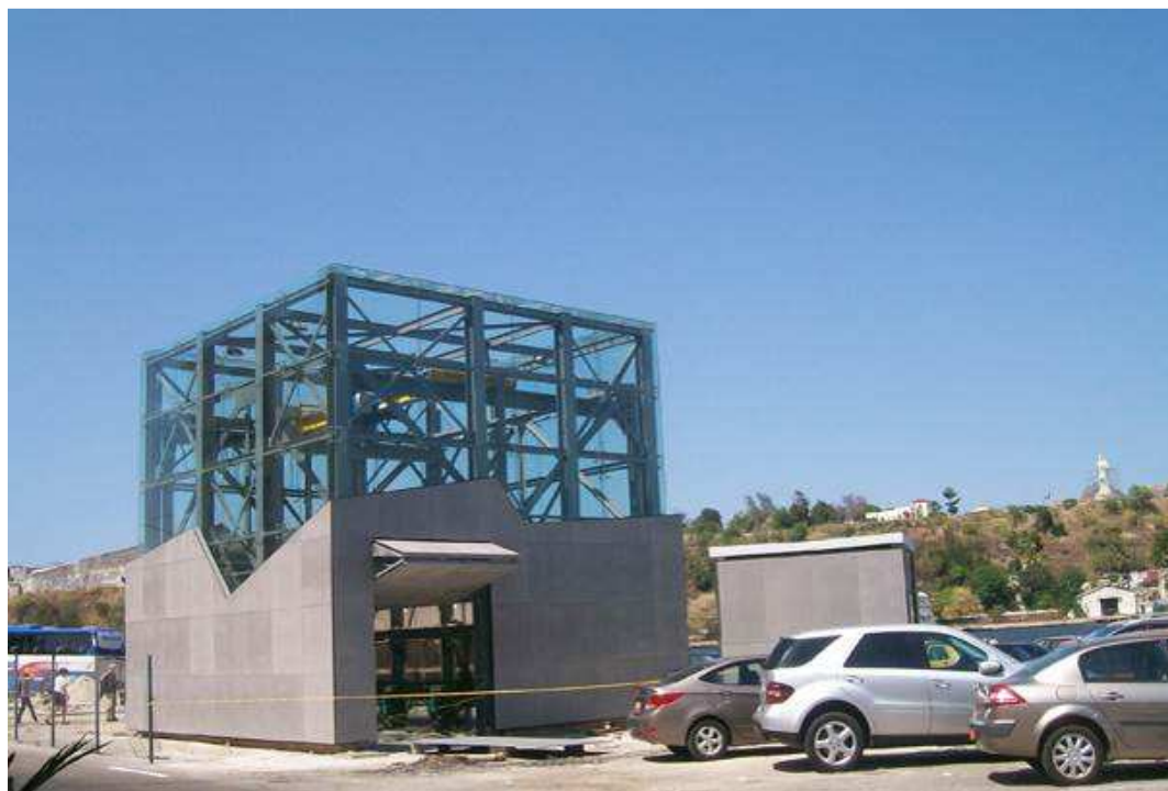
Un dé d'acier de béton et de verre sert d'écrin désormais aux 3 dégrilleurs du SIAAP