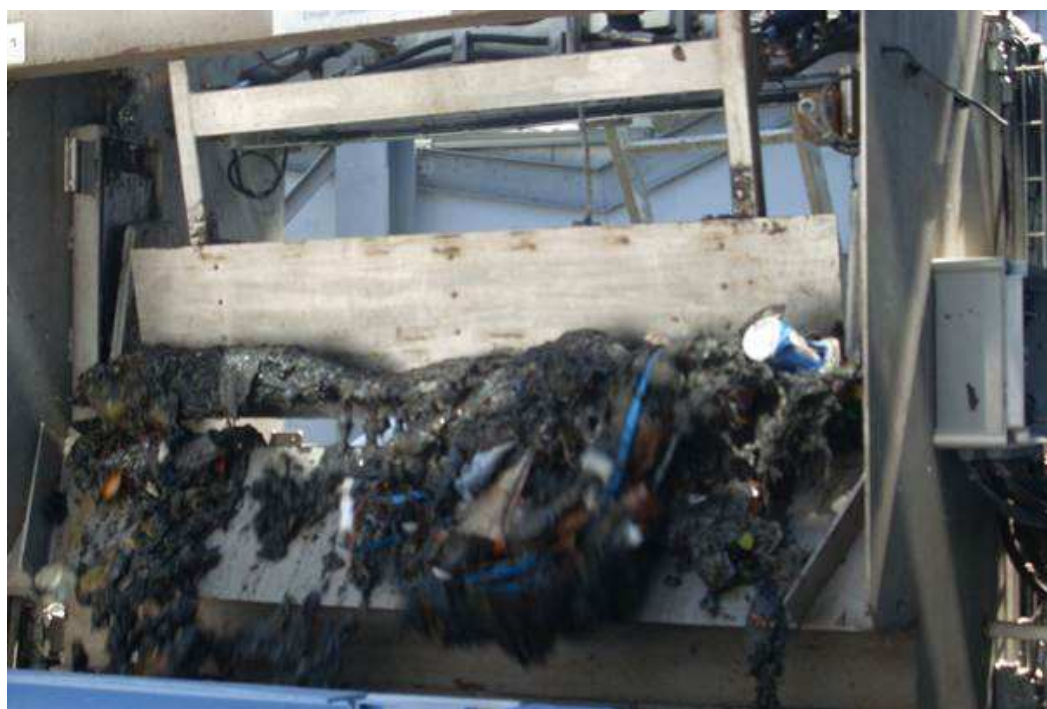
Refus des grilles