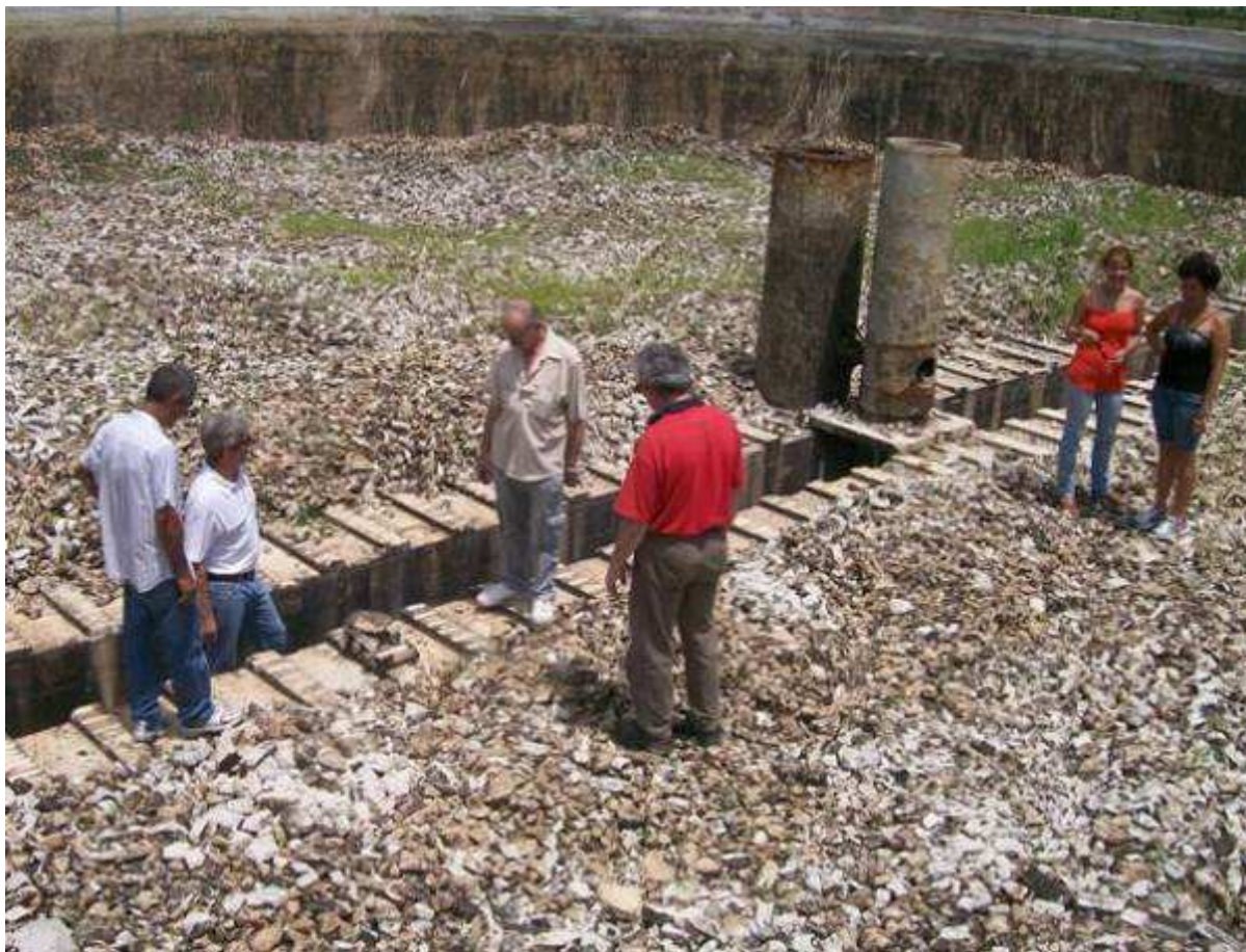
Examen du radier du lit bactérien et reconstitution de son aération