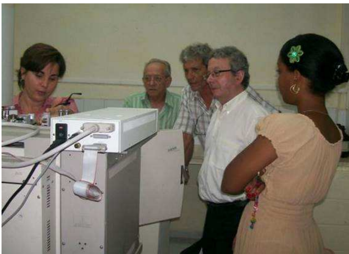
Un chromatographe constitue la dernière mise à disposition par le SIAAP d'un appareil réformé