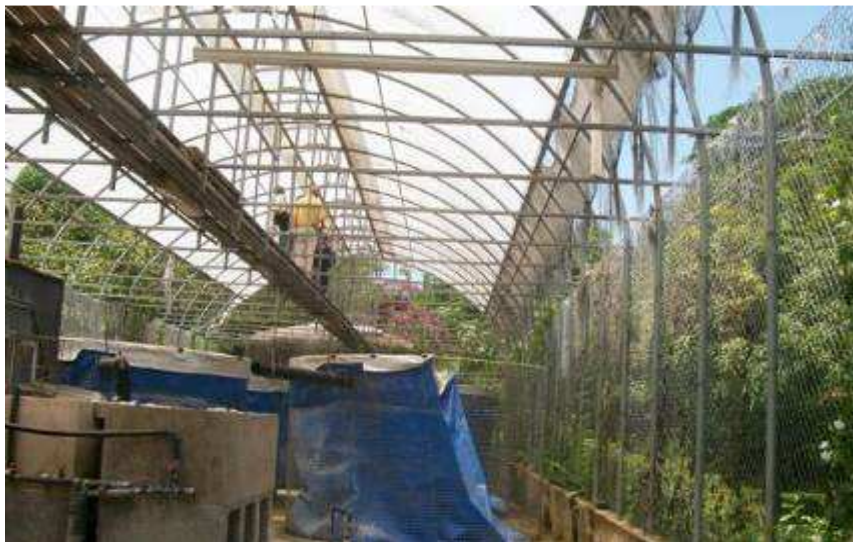
La Station de Finlay

Ce point ainsi que la réhabilitation des trois stations font partie des propositions incluses dans le projet de reconquête du rio Almendarés.