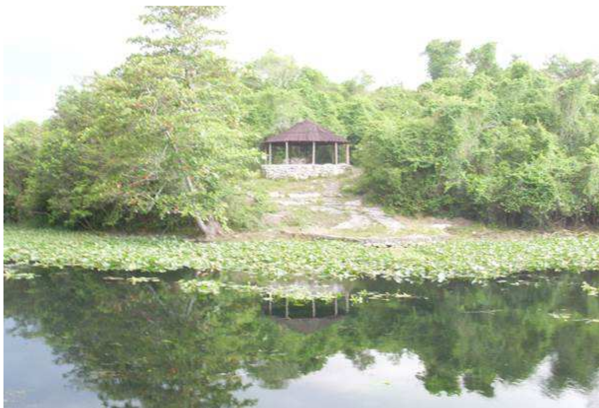
Le rio Ariguanabo

L'ensemble des appareils devrait être opérationnel d'ici septembre.