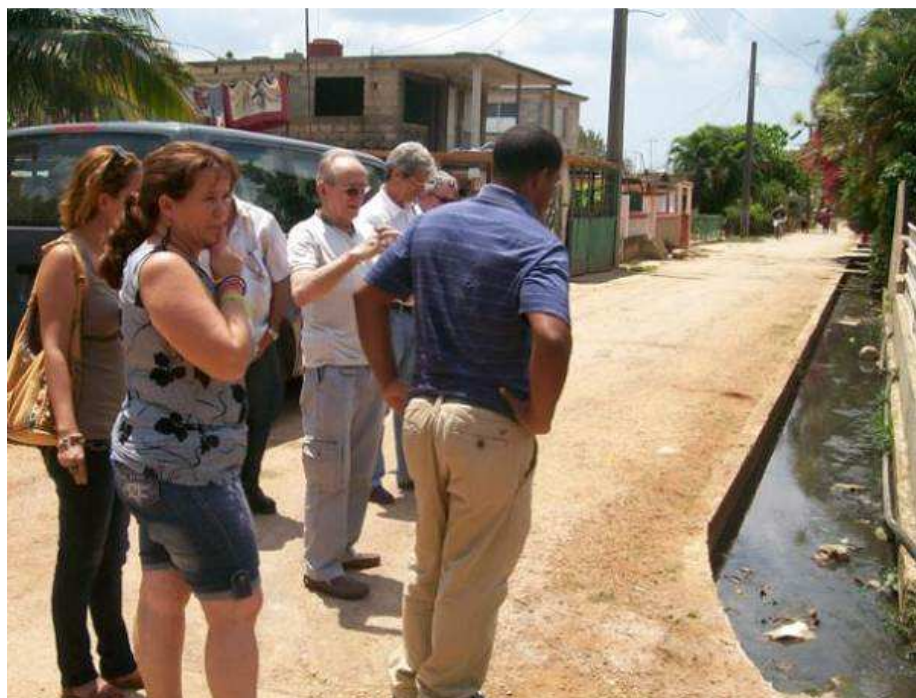
L'égout à ciel ouvert dans les rues de Las Margaritas

Ces tuyaux conduisent à une station de pompage qui refoulera dans des lagunes. Cette opération sera menée en parallèle sur un autre financement Les travaux doivent commencer en mai 2013, pour une durée contractuelle de 11 mois.