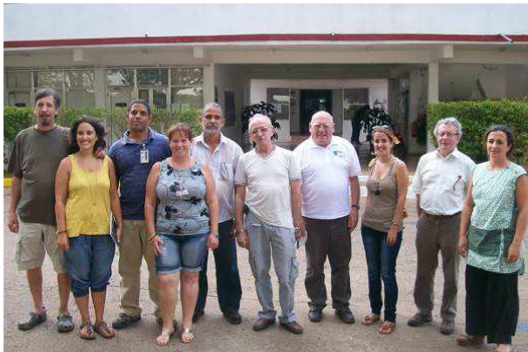
Les représentants de l'Ecole de Cinéma, de l'université, d'Artémisa et de C.C.F.

La direction de l'école souhaite une visite de l'école par une délégation de Cuba Coopération France. Accord de principe a été donné.