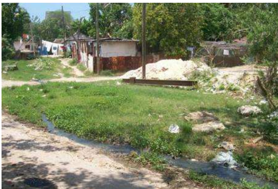
POGOLOTTI Faute de traitement, les eaux d'égouts ruissellent sur la chaussée