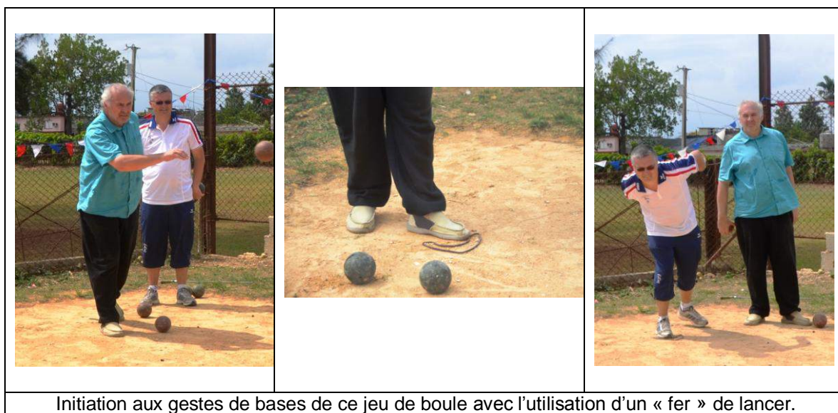
Initiation aux gestes de bases de ce jeu de boule avec l'utilisation d'un « fer » de lancer.