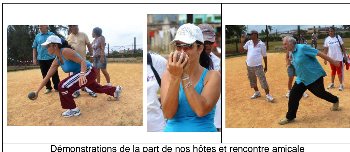
Démonstrations de la part de nos hôtes et rencontre amicale

Pour pointer, il existe deux types de technique. D'une part, on place le pied d'appui (droit ou gauche à sa convenance), on peut lancer de manière dynamique en pouvant suivre son lancer. D'autre part à partir de ce positionnement initial, il est possible de faire un pas dans n'importe quelle direction (ceci se rapproche beaucoup du jeu provençal). Etant donné la grosseur des boules, les autochtones jouent exclusivement main ouverte. Comme les jeux sont très lisses, cette technique semble plus adaptée comme cela est le cas pour la Raffa Volo.