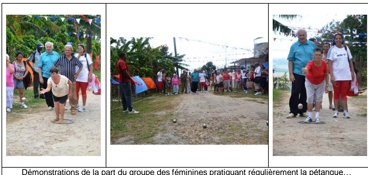
Démonstrations de la part du groupe des féminines pratiquant régulièrement la pétanque...

Lors de notre arrivée, nous avons pu observer 8 femmes qui jouaient sur cette aire. Toto Monitor nous explique que ces femmes se regroupent de manière quotidienne entre 16h00 et 19h00 pour jouer à la pétanque. De ces pionnières dans l'activité, de nombreuses personnes sont venues se greffer à ce groupe pour venir utiliser et animer ce terrain.