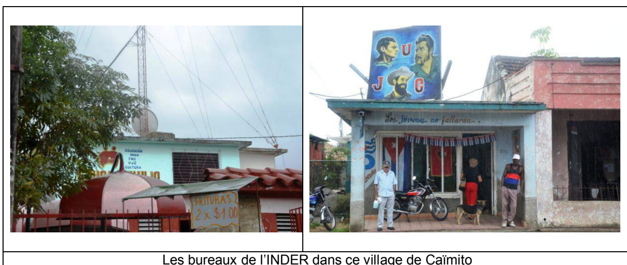
Les bureaux de l'INDER dans ce village de Caïmito

Suite à l'annulation du déplacement à Matanza pour des problèmes de transport (problème récurrent sur l'île) et une prévision météorologique peu clémente, il a été décidé de revenir sur Caïmito pour aller dans les quartiers afin de mieux se rendre compte de la réalité de la pratique, exposée précédemment.