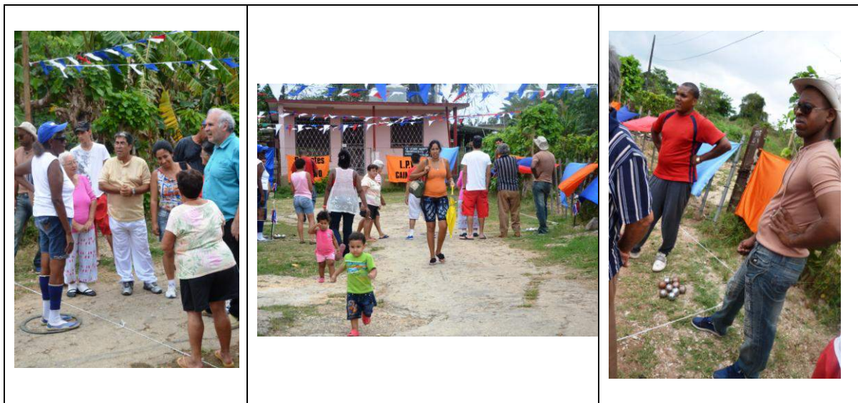
En haut de la colline, une aire de jeu matérialisée avec une pratique féminine