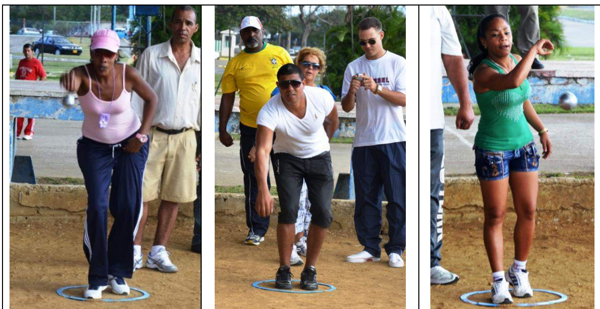
Du style en attendant l'efficacité !!

Après quelques répétitions de gestes techniques de point et de tir, nous sommes rapidement passés à des jeux dédiés aux débutants. Du Jeu de massacres au Jeu du Morpion, en passant par les jeux du damier, les équipes composées se sont confrontées dans une excellente ambiance mais aussi avec un fort esprit de compétition.