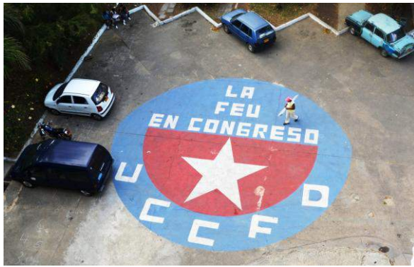
Cours à l'université de Sports de La Havane

Dès notre arrivée sur le site de l'université, nous constatons que le personnel prépare l'aire de jeu, en ratissant la terre et en repeignant les bordures en bleu. Tout est fin prêt pour la partie pratique de mardi avec l'ensemble des professeurs de l'université.