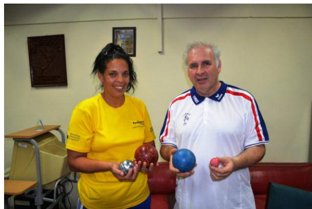
Des boules d'environ 120mm de diamètre et d'un poids de 2 kg...

Pour mieux comprendre ce jeu, il sera nécessaire de le pratiquer ce qui sera sûrement le cas lors de notre déplacement à Caïmito, fief de cette discipline à Cuba.