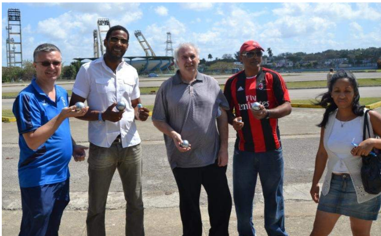
Photo souvenir devant l'entrée de l'INDER pour immortaliser cette rencontre

Il nous a avoué avoir déjà vu joué à la Pétanque lors de ses nombreux passages en Europe. Suite à l'idée selon laquelle des sportifs français pratiquaient la pétanque après leur carrière, Javier Sotomayor et Alberto Sotolongo émettent le vœu que la prochaine et première sélection cubaine pourrait être composée d'anciens champions olympiques... Idée un peu folle mais pourquoi pas !