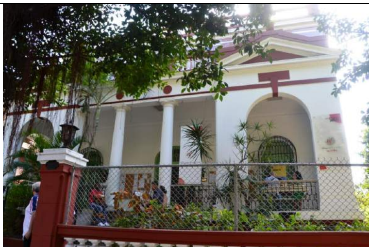
Le site de l'alliance Française à Cuba, lieu prestigieux...

Le Directeur nous confie la mise en place d'un troisième site dans le quartier de la vieille Havane dans un avenir très proche et dans un site magistral, un ancien palais entièrement réhabilité.