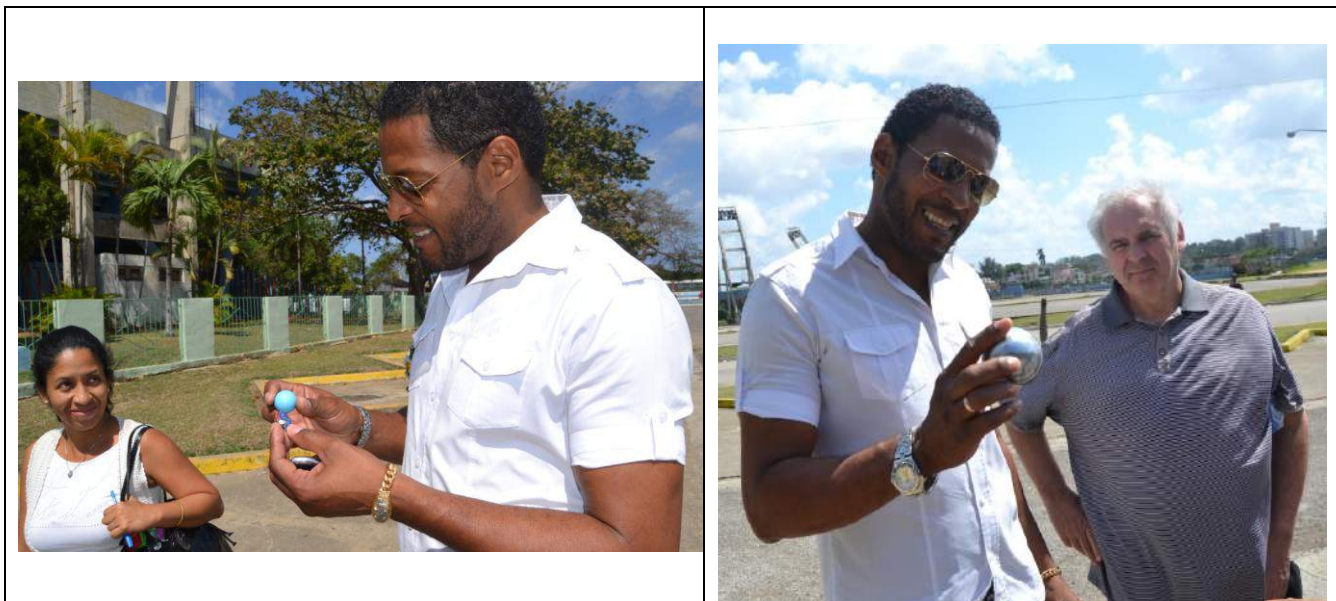
Javier Sotomayor avec le bouchon des championnats du Monde et une petite boule dans sa grande main...