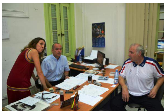
Discussion avec la responsable pédagogique pour la projection du film Banco-boules pour la Chine

En échangeant avec sa responsable pédagogique (l'Alliance Française a plus 7000 élèves cubains qui viennent apprendre le français), s'organise de manière très impromptue une conférence autour de la projection du d'Alexandre DELAYGUES, « Banco Boules pour la Chine » avec plusieurs classes. Cet échange est programmé le jeudi 7 mars 2013 à 18h00.