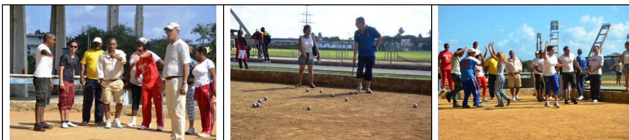
Des jeux très mouvementés avec un engouement remarquable pour gagner les oppositions

Après quelques répétitions de gestes techniques de point et de tir, nous sommes rapidement passés à des jeux dédiés aux débutants. Du Jeu de massacres au Jeu du Morpion, en passant par les jeux du damier, les équipes composées se sont confrontées dans une excellente ambiance mais aussi avec un fort esprit de compétition.